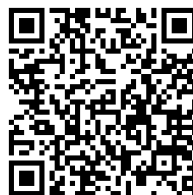
跨域菁英課程報名表