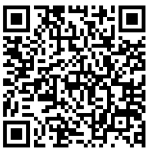
跨域菁英課程說明會報名表