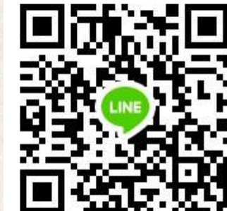
跨域菁英課程諮詢 line 群組